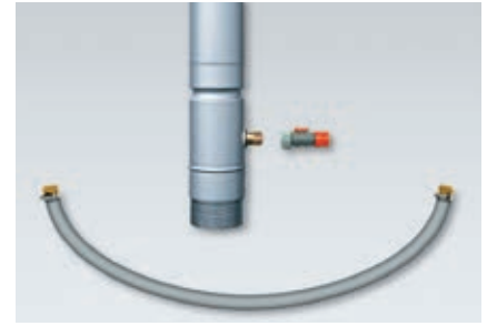
Das Verkaufset: Der RHEINZINK-Regensammler mit GARDENA Regulierstop, inkl. 1 Zoll-Verbindungsschlauch