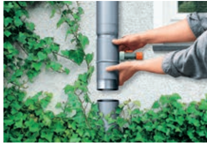
Einfaches Einsetzen und Justieren des RHEINZINK-Regensammlers