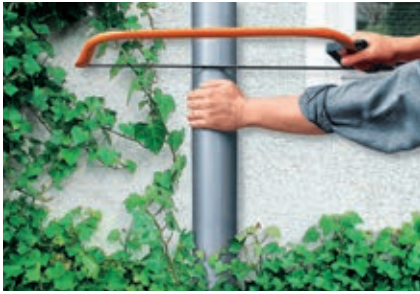
Heraussägen eines ca. 30 cm langen Fallrohrstückes